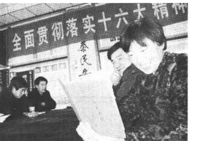
广饶镇司家村在文明诚信活动中，编印了“法德结合、文明理家村民手册”，发到村民手中。内容包括农村法德教育五字歌、司家村规范化管理规定等，语言通俗，道理深刻，受到群众欢迎。

抓好法制建设，对少数不守规矩、违反纪律的人实行强制措施。他们建立了举报箱，设立了举报电话，成立了信访领导小组，组建了纪检委，设立了农村财务结算中心。自1997年至今，垦利镇共接待来访人员40人次，处理不合格党员5名，案件办结率100%，得到了群众的认可。(耿敬书)