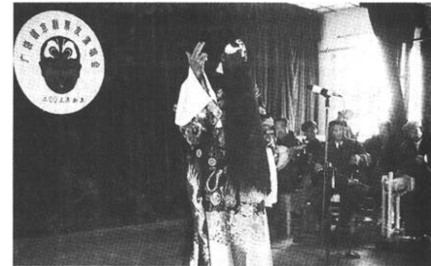
广饶镇组织广大文艺爱好者，以票友会的形式开展文化下乡巡回演出活动，积极向广大群众宣讲十六大精神。

在此奉劝广大消费者，在消费时首先要看有主见，不上“托儿”及虚假广告的当；其次不要贪小便宜；在不明就里的情况下不要盲目消费。（尹泽江 刘爱君）