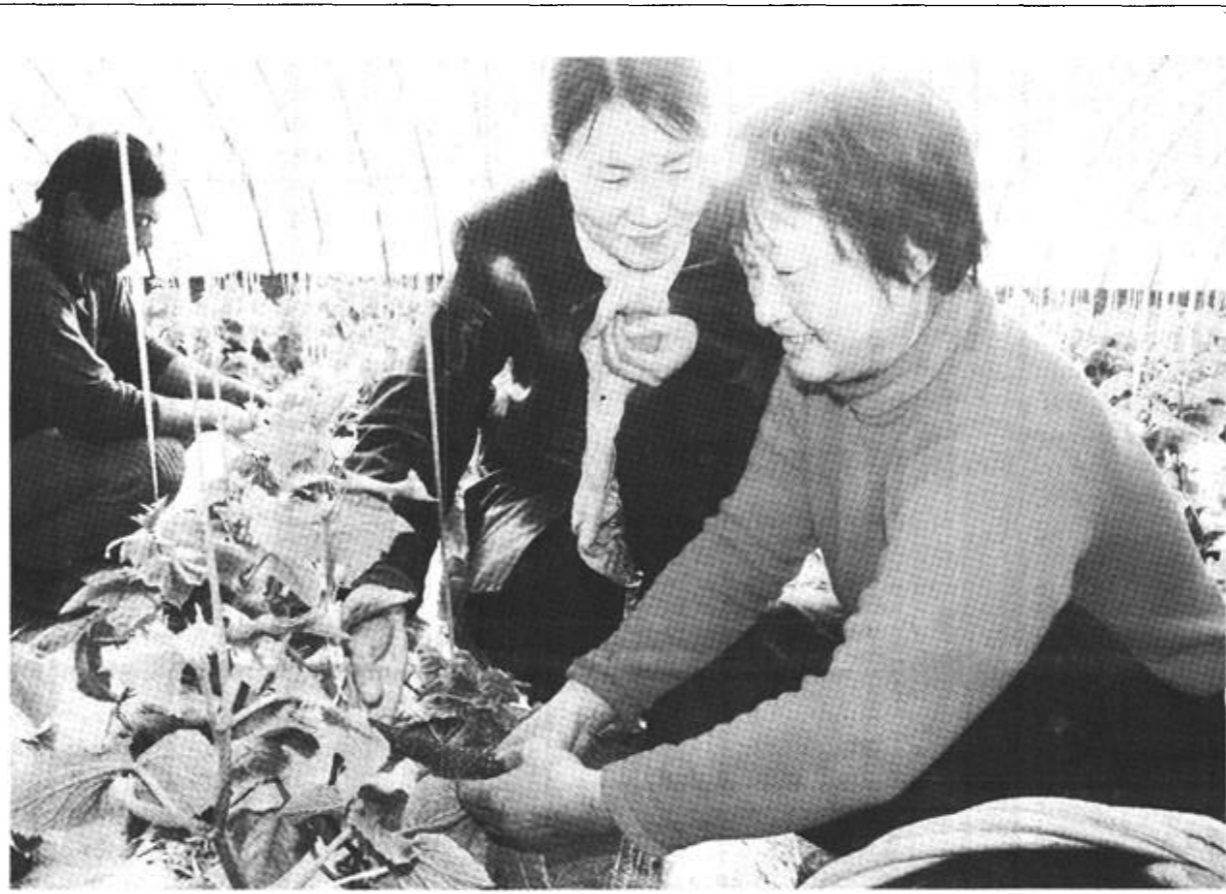
垦利县董集乡充分利用黄河滩区的资源优势，大力发展滩区大棚蔬菜，为农民增收创造良好条件。截至目前，该乡已发展滩区大棚蔬菜170余栋，种植的各种蔬菜陆续进入收获期。